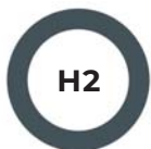
GRIS FONCÉ 432C