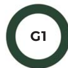
VERT FONCÉ 533C